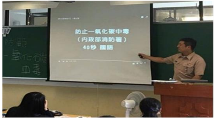
配合全民國防教育課程宣導